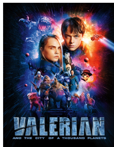
Valerian And The City Of 1000 Planets

Pod hasłem #WELOVECINEMA Grupa BNP Paribas wspiera kino na całym świecie! Jest obecnie największym europejskim bankiem finansującym kinematografię. Angażuje się w produkcję i promowanie sztuki filmowej. Pomaga branży filmowej na wielu poziomach. Wspiera młode talenty i daje nowe możliwości uznanym artystom.